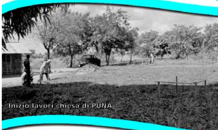
Inizio lavori chiesa di PUNA