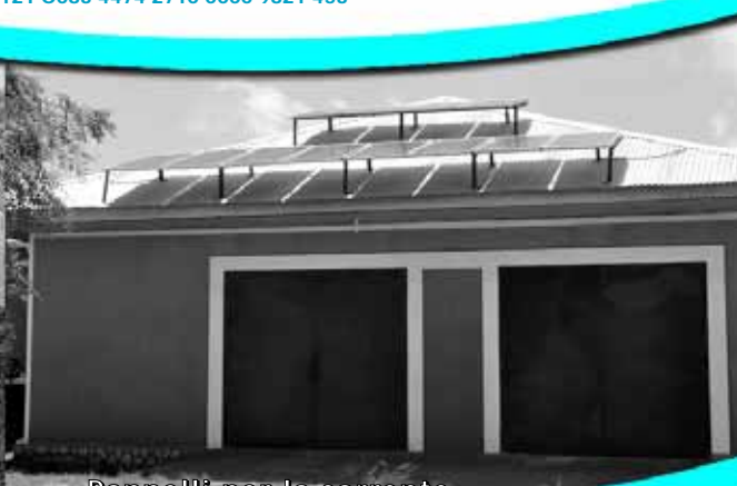
Pannelli per la corrente