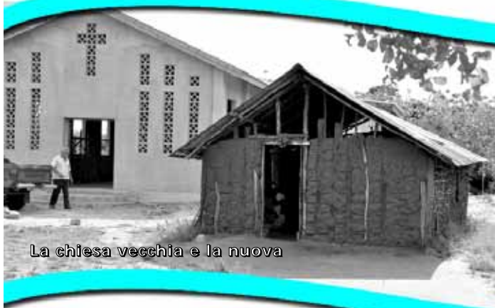
La chiesa vecchia e la nuova