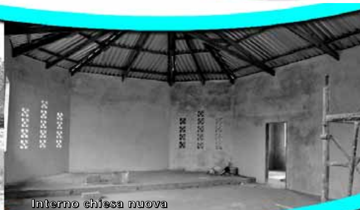
Interno chiesa nuova

Alla fine di novembre abbiamo potuto verificare di persona e documentare con foto, la realizzazione di due dei tre progetti che Noi per Gli Altri e Caritas avevano programmato alla fine del 2008 per l'Africa: