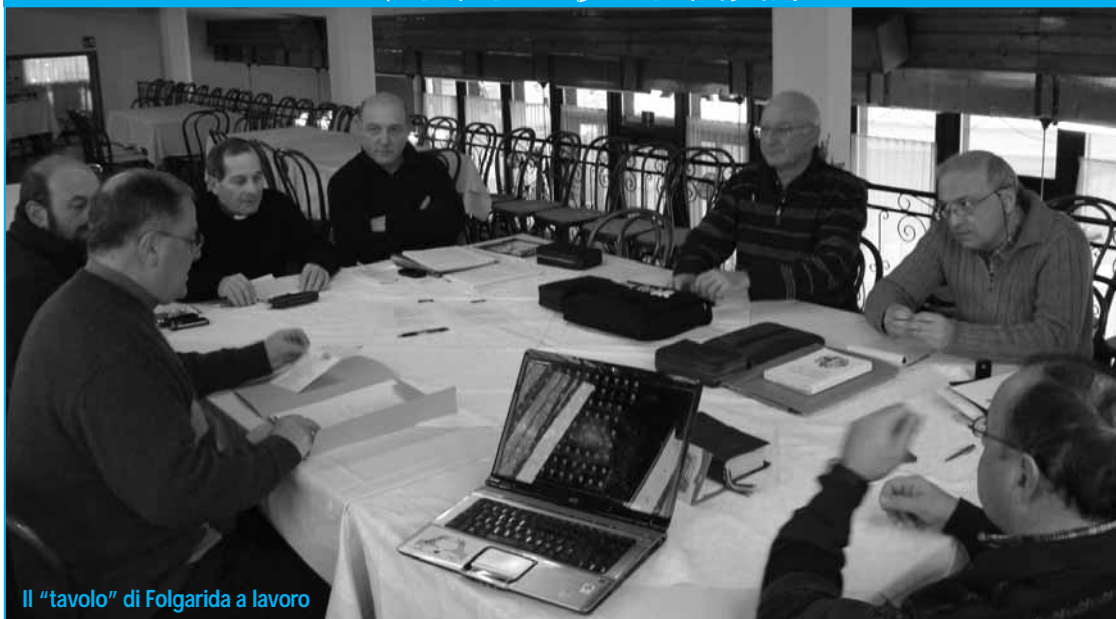
Il "tavolo" di Folgarida a lavoro

Per il terzo anno si è svolto a Folgarida, dall'8 al 12 febbraio, il "Tavolo di Folgarida" del Co.Pas., un'occasione preziosissima di verifica e di programmazione per il nuovo anno pastorale 2010-2011. Tra i tanti temi su cui riflettere ha avuto un ruolo centrale il tema della prossima Assemblea Pastorale di settembre. Di fronte alla necessità di concretizzare tutto il lavoro dell'anno scorso si è pensato di mettere al centro della riflessione il tema delle giovani famiglie. Certo non c'è ancora un titolo preciso, ma il tema dell'educazione alla fede delle nuove generazioni fin dalla primissima età, è sembrato quello più adatto per cominciare. Un altro punto di riflessione importante è stata la Visita di Benedetto XVI a Carpineto Romano il 5 settembre 2010, che segnerà il grande appuntamento di questo Anno Leoniano. La figura di Leone XIII