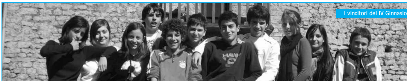
I vincitori del IV Ginnasio