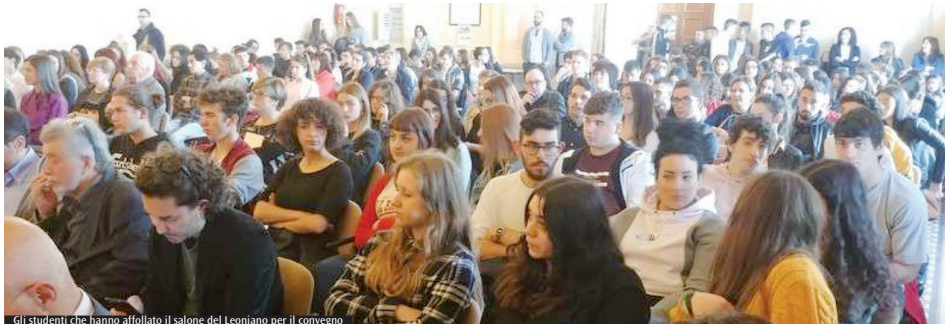
Gli studenti che hanno affollato il salone del Leoniano per il convegno

Grande successo per il concorso diocesano organizzato dall'Ufficio scuola. Ad Anagni la conclusione