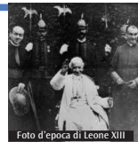
Foto d'epoca di Leone XIII