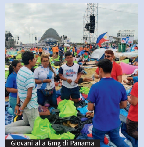
Giovani alla Gmg di Panama