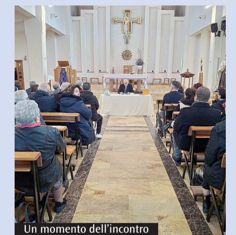
Un momento dell'incontro