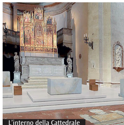
L'interno della Cattedrale

Da tutto il Lazio sono arrivate a Fiuggi, nello scorso fine settimana, circa mille persone per partecipare agli esercizi spirituali della fraternità di Comunione e liberazione. I convenuti si sono ritrovati al Palacongressi di Fiuggi per i collegamenti in diretta con la Fiera di Rimini, secondo una modalità che è stata ripetuta anche in alcune città di Sicilia e Sardegna e, all'estero, da circa 20 Paesi. Gli iscritti alla Fraternità hanno così avuto modo di ascoltare e riflettere sulle meditazioni che da Rimini hanno svolto il vescovo di San Miniato, Giovanni Paccosi e il cardinale Kevin Farrell, prefetto del Dicastero per i laici, la famiglia e la vita, prima dei ringraziamenti e dei saluti finali di Davide Prospero, presidente della Fraternità di Cl. Il tutto in un clima di grande amicizia e di intensa partecipazione, soprattutto da parte di tanti giovani.