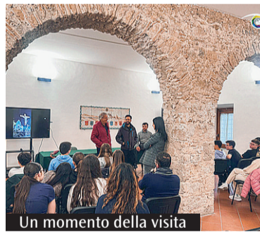
Un momento della visita