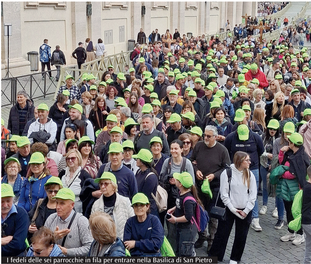
I fedeli delle sei parrocchie in fila per entrare nella Basilica di San Pietro

Partiti intorno alle 8 dai piazzali delle rispettive chiese, preparandosi ulteriormente alla giornata con l'ausilio di un istruttivo pieghevole con info e notizie varie su Giubileo e indulgenza, i pellegrini hanno fatto dapprima tappa a San Paolo fuori le Mura, pacificamente "invasa" dai loro trecento berretti verdi, segno di riconoscimento della "spedizione". E qui è stata subito chiara l'impronta di grazia che poi tutta la giornata avrebbe avuto, così come di comunione e di cammino fraterno di una Chiesa universale. Per entrare in Basilica, infatti, si è fatta la fila insieme a tanti pellegrini dell'arcidiocesi di Milano, alla seconda giornata del loro pellegrinaggio giubilare. Ed è stato subito un piacevole e fraterno scambio di saluti, ben oltre gli sconti ai sacramenti, con l'innata simpatia