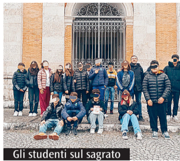
Gli studenti sul sagrato