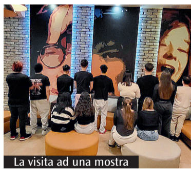
La visita ad una mostra