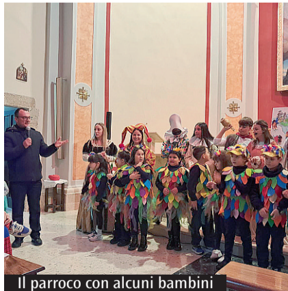
Il parroco con alcuni bambini