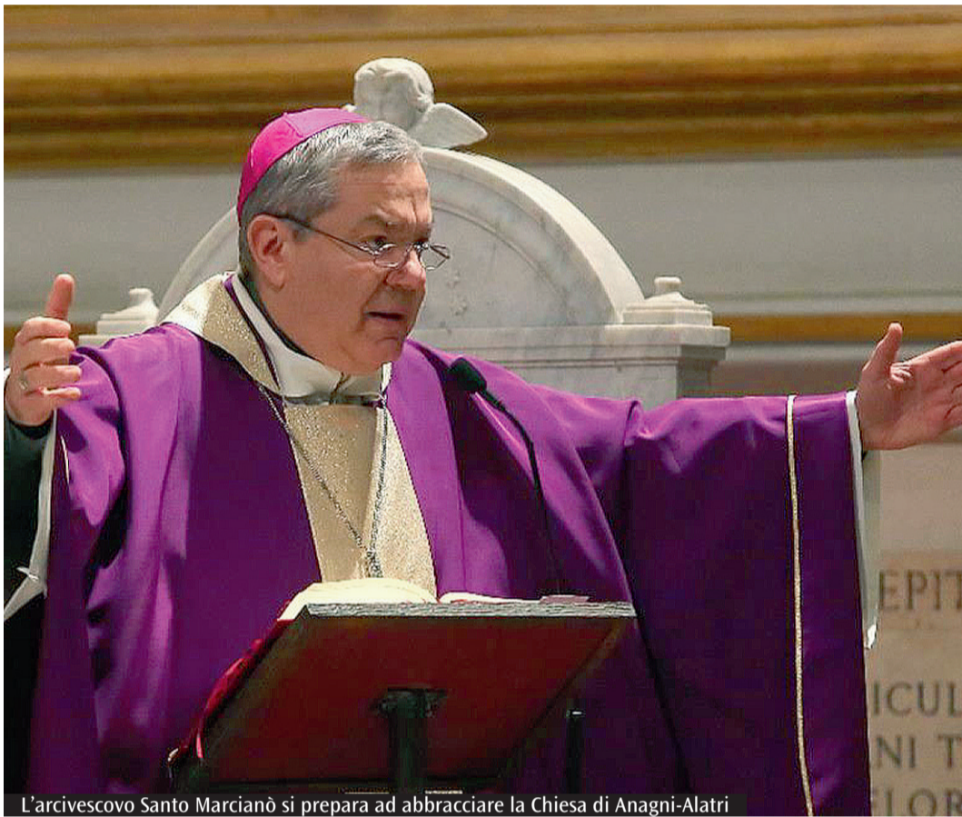
L'arcivescovo Santo Marciànò si prepara ad abbracciare la Chiesa di Anagni-Alatri

«Già amo questa Chiesa con tutto me stesso!» aveva avuto modo di dire Marciànò il 1° luglio scorso, non appena nominato da papa Leone «che ringrazio commosso per la fiducia con cui mi ha voluto pastore di questa Chiesa». E in quel primo indirizzo di saluto, già si delineavano le linee pastorali del nuovo presule, ad iniziare da quel desiderio di comunione «dono del cuore di Gesù, essenza della Chiesa: sorgente di sinodalità, unità, servizio. Dono che desidero fortemente condividere con voi, accogliendo anche il desiderio di Leone XIV», scriveva sempre in quell'indirizzo di saluto ai presbiteri e ai fedeli tutti delle due diocesi. Una comunione che si fa dunque anche segno di unità, «l'unità dei figli e con i figli che è la gioia più grande per un padre, per un vescovo! E a noi essa viene