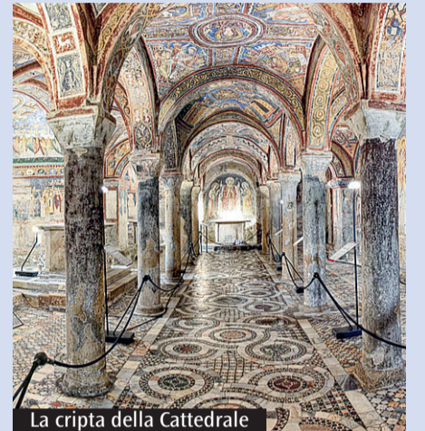
La cripta della Cattedrale