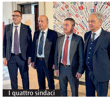
I quattro sindaci

Si dovrà attendere ancora un mese prima di conoscere le dieci città, o unioni di città, candidate a Capitale italiana della Cultura 2028. La decisione del Ministero della Cultura, inizialmente prevista per i giorni scorsi, è stata invece spostata al 20 gennaio 2026. Tra i candidati c'è anche il progetto "Hernica Saxa", messo in piedi unitariamente da Alatri, Anagni, Ferentino e Veroli, tutte città peraltro ricadenti nelle diocesi unite in persona episcopi di Anagni-Alatri e Frosinone-Veroli-Ferentino, e non a caso l'arcivescovo Santo Marciànò ha espresso in più occasioni profondo compiacimento per l'iniziativa, affermando tra l'altro in un messaggio inviato ai sindaci di Alatri e Veroli per le presentazioni in loco: «La