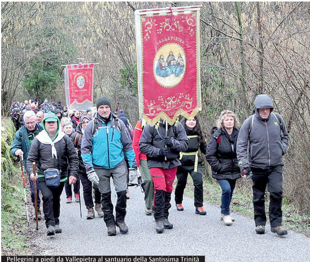
Pellegrini a piedi da Vallepietra al santuario della Santissima Trinità

Frosinone, da quella di Roma e da altre città del Lazio, hanno quindi intrapreso il cammino verso il santuario, accompagnati per un tratto dallo stesso vescovo Spreafico, che ha recitato con loro il Rosario. Giunti al santuario, i pellegrini hanno potuto venerare la sacra immagine della Santissima Trinità nell'unico giorno di apertura invernale straordinaria. Alle 10.30, presso la chiesa nuova dedicata a San Giovanni