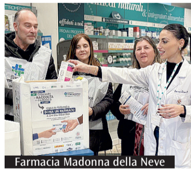
Farmacia Madonna della Neve

La Caritas interdiocesana di Frosinone-Veroli-Ferentino e Anagni-Alatri ha partecipato, dal 10 al 16 febbraio scorsi, alla Giornata di raccolta del farmaco che si è svolta proprio in queste giornate in tutta Italia, grazie alla Fondazione Banco Farmaceutico Ets che opera come ente no-profit. Per una intera settimana i cittadini hanno quindi potuto acquistare farmaci di automedicazione (da banco) nelle farmacie aderenti, raccolti poi da vari enti assistenziali - circa duemila in tutta Italia e decine anche sul territorio ciociaro - che li destinano alle persone in stato di bisogno. Si tratta quindi di una risposta concreta al bisogno farmaceutico dei più fragili, in collaborazione con le realtà della carità, attraverso un cammi-