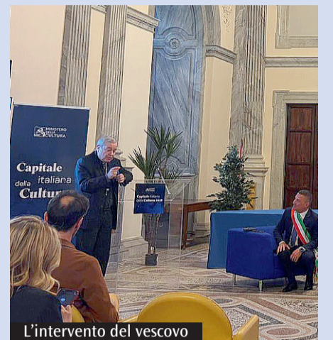
L'intervento del vescovo