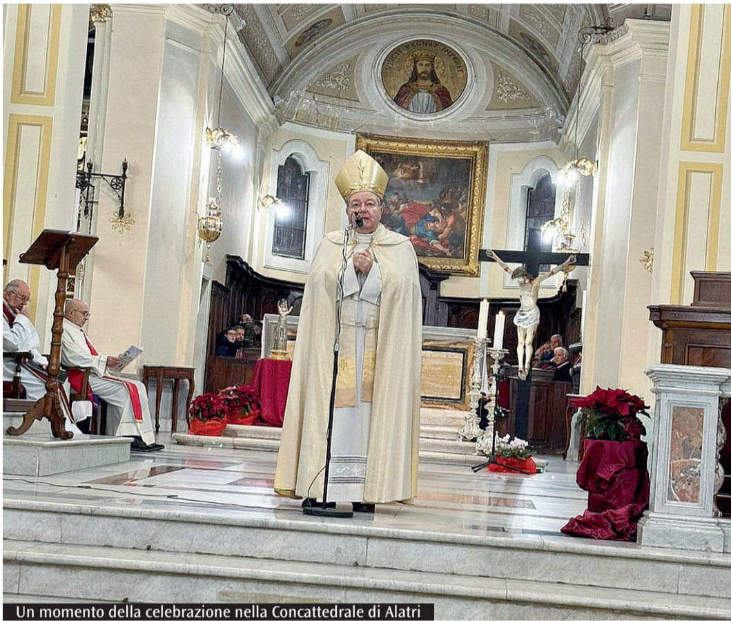
Un momento della celebrazione nella Concattedrale di Alatri

quella del Battesimo di Gesù, il vescovo Marciànò ha sottolineato come «anche il Battesimo del Signore è "epifania", cioè "manifestazione", "rivelazione" di Gesù e della Sua realtà divina e umana. E Gesù ci dice che il primo passo per camminare sulle vie di Dio è sentirsi figli, avere consapevolezza di essere "figli amati". È la nostra identità, quasi un Dna che ci definisce, a partire dal dono della vita e dal