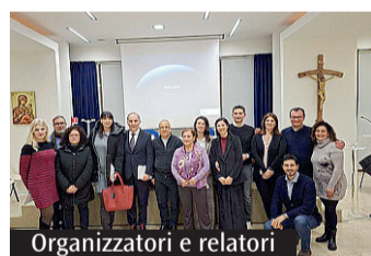
Organizzatori e relatori